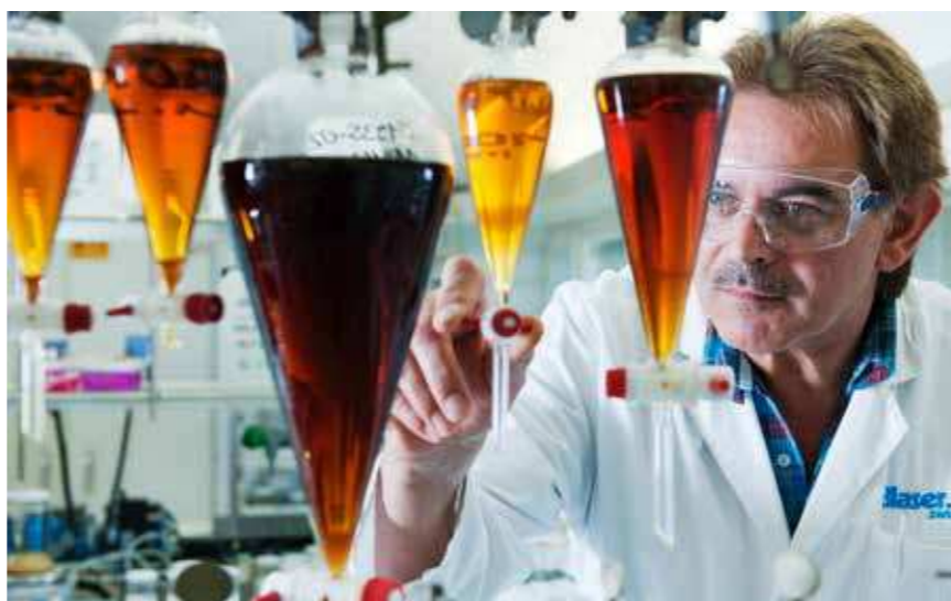
Certifikované podľa ISO 9001/14001/21469 OHSAS 18001